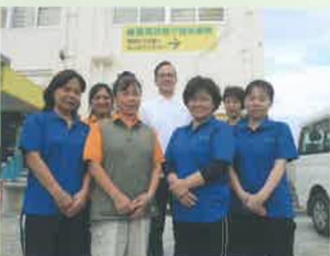
居宅サービス事業所