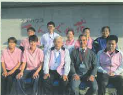
ケアハウスていんさぐぬ花