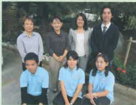
地域支援センター