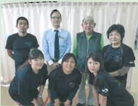
みどり学童クラブ