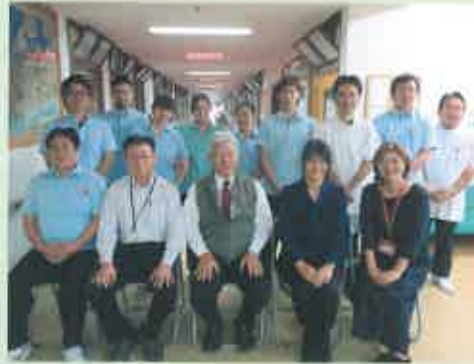
介護老人福祉施設緑樹苑