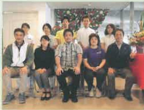
ケアハウスはいびすかす