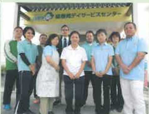
デイサービスセンター