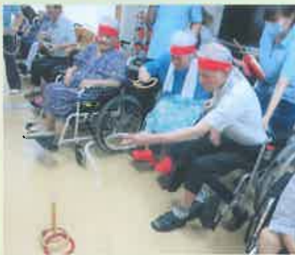
ケアハウスはいびすかす