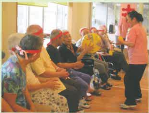
デイサービスセンター

10月10日(月)、11日(火)の二日間にわたり、緑樹苑デイサービス運動会を開催した。