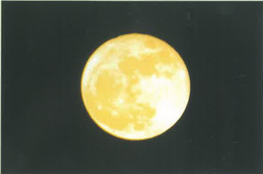
(緑樹苑内撮影 11月15日)