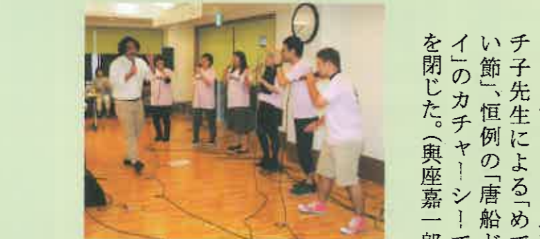
地方も緑樹会職員が務める

懇親会の余興では、ケアハウスでいんさぐぬ花職員による『国頭サバクイ』の民踊りが披露され、その滑稽な踊りに会場の笑いを誘った。また、同じく職員による琉舞も披露された。