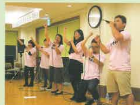
素敵な歌声を披露したアカペラグループ「マフィンズ」