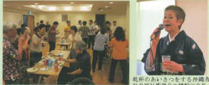
和やかな雰囲気での懇親会の様子。

懇親会の余興では、ケアハウスでいんさぐぬ花職員による『国頭サバクイ』の民踊りが披露され、その滑稽な踊りに会場の笑いを誘った。また、同じく職員による琉舞も披露された。