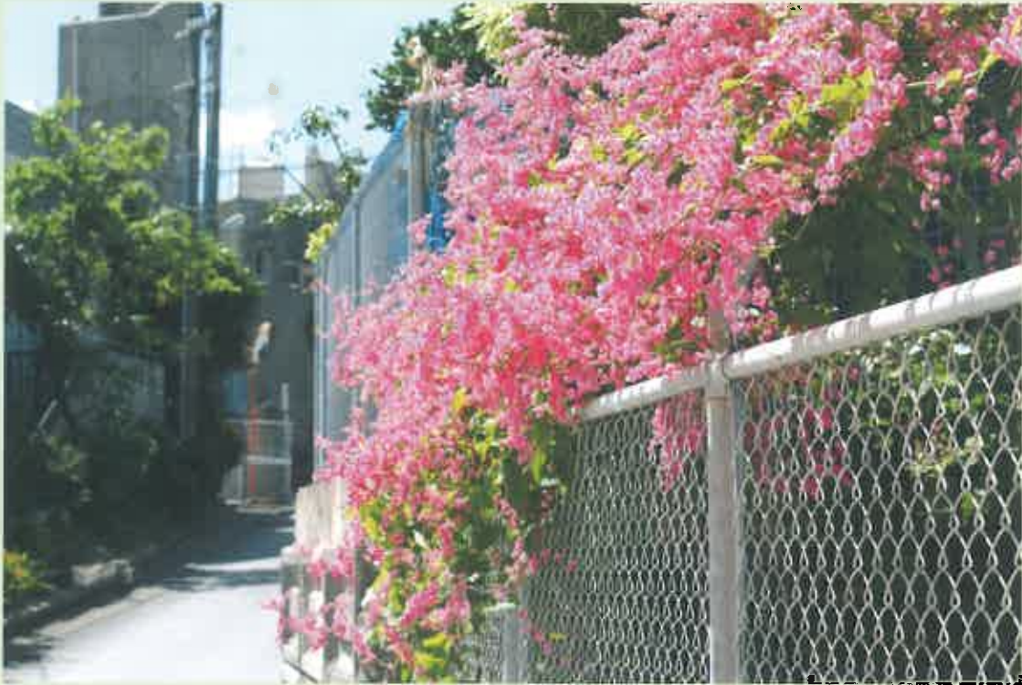
アサヒカズラ(緑樹苑内撮影)