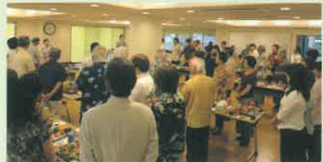
懇親会の様子。多くの後援会会員が集った。