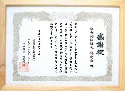
↑ネパール募金に緑樹会へ感謝状が贈られた。←緑樹会職員や学童クラブの児童達から寄せられた靴はフィリピンへ送られる。