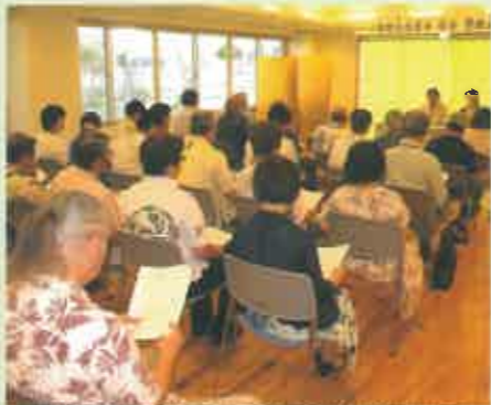
総会では事業報告や収支決算の報告が行われた