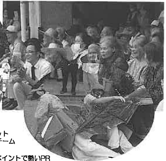
フェイスペイントで勢いPR転倒で視線釘づけし特別賞のはいびすかすチーム