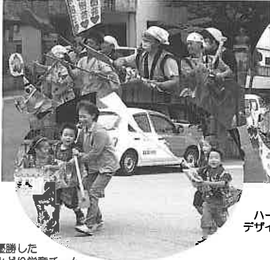
ハートで審査員の心もグッとデザイン賞のデイサービsteam

かわいさと元気で見事優勝したみどり学童チーム、デザイン賞狙いでフェイスペイントまで施し、余りの勢いに転覆ならぬ転倒し会場を沸かせたはいびすかすチーム。久々に苑内を訪れたていんさぐぬの花の皆さんも終始満面の笑みを見せ、楽しさ満載の「地バーリー」でした。(幸喜穂乃)