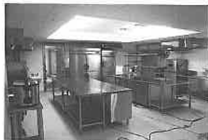
厨房、入居者の毎日の食事が作られる