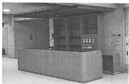
フロアスタッフステーション