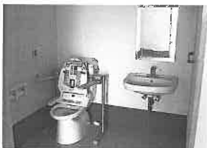
居室内の洗面台・トイレ(手摺り付き)