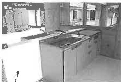
入居者用の共有キッチン