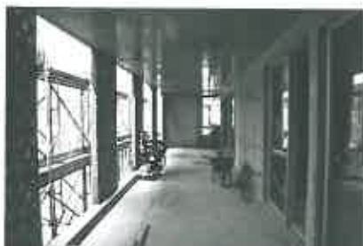
ベランダ。回廊になっており、居室(写真右手)から出入りできる。