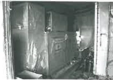
2月11日、自家発電設備が搬入設置。また、屋上にも受電設備が設置された。

3月24日に竣工を予定している「ケアハウスていんさぐぬ花」建築工事の進捗状況2月は、内装工事は壁・天井のボード、床シートや浴室等のタイル張りのほか、建付けの家具、扉などの取付け、各階の塗装などが行われている。また、外壁には花ブロックが積み上げられ、屋上の防水処理、屋根の漆喰塗りや瓦葺きが行われるほか、高圧受電設備、上下水道、ガスなどのインフラ設備も整う。 3月は外構や仕上げの工事も、最終的な各種点検が行われ、完成の運びとなる。(砂川智規)