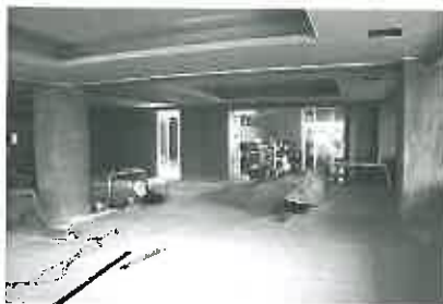
1階多目的スペース兼リビング室。サッシ、ガラスが入り、天井ボードが張られた。