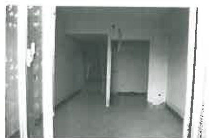
2階居室。右手の側室が洗面所となり、洗面台、トイレが設置される。