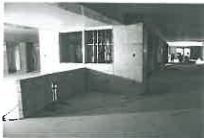
2階リビング。コンクリートブロックを挟んで入居者用のキッチンが設置される。