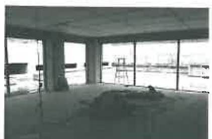
4階ロビースペース。奥は屋上テラスとして、入居者らの憩いの場となる。