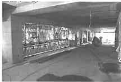
利用者の居住スペースとなる2階フロア。広々としたリビング部分。