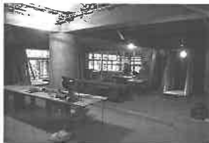
1階多目的スペース兼リハビリ室の様子。内装の建付けや造作作業が行われている。