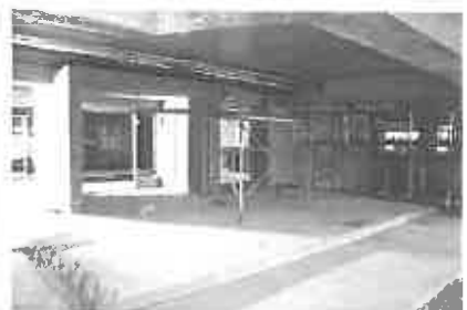
1月9日。建物入口(エントランス)部分の様子。