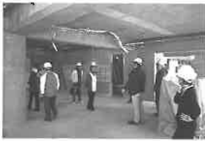
1月17日。緑樹会職員らによる現場視察が行われた。