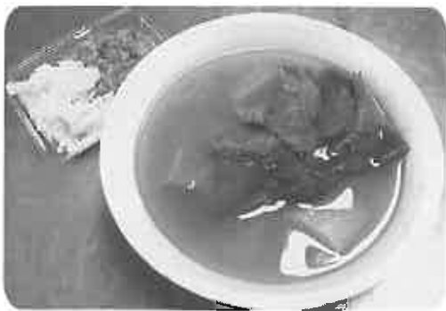
▶馬汁の飯のショット

食欲の秋から年末、年始とごちそう続きで気が付けばズボンのボタンが少しきつくなったり、うなづきがするのですが、そう感じるのは私だけでしょうか? 健康弁当を続けていた方の中には大分体重が落ちたと嬉しそうに話される方も何人かいらっしゃいます。最近ふれあいぷらざには新メニューとして馬汁が仲間入りしました。これがなかなかダイエット効果に期待の持てるメニューで、馬肉には「Lカルニチン」が多く含まれており、その「Lカルニチン」は血中の遊離脂肪酸を筋肉に運び脂肪燃焼を促すアミノ酸を多く含んでいます。しかも女性に不足しがちなミネラル、鉄分、カルシウム、ビタミンB12も多く含まれているとのこと。女性や体重、体調が気になる