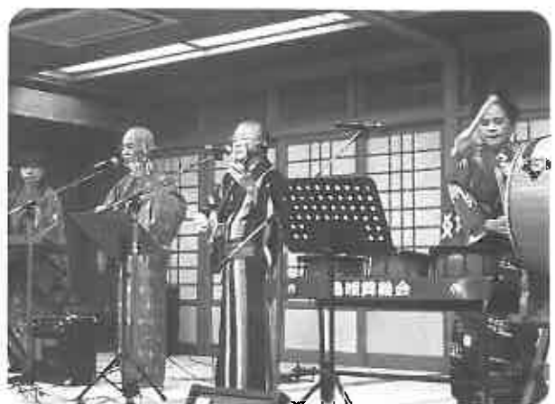
▲素晴らしい演奏を披露した「島唄 舞鶴会」のみなさん