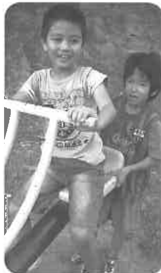
▲年末の園外活動(コザ運動公園)の子どもたちの様子

※天候や子供たちの体調によって変更もあります。また、プロ野球見学にも行く予定です。