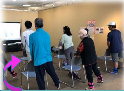
いきいき百歳体操 体験コーナー

今後も、多くの方に包括支援センターの役割等を知ってもらえるよう、様々な場所で周知活動に努めていきたいと思っております。是非みなさんの集まる場所などに呼んでくださいね～☆